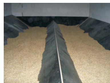
von Nolting erstelltes Pelletlager (Unterboden)