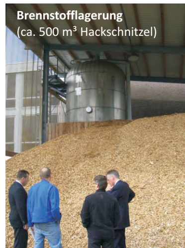
Brennstofflagerung (ca. 500 m 3 Hackschnitzel)