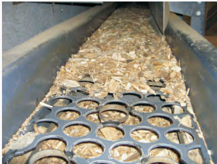
Mit der Vibrations-Rinne werden zu grobkörnige Fraktionen ausgesiebt: so wird eine störungsfreie Beschickung der Hackschnitzel über die Förder-schnecken garantiert