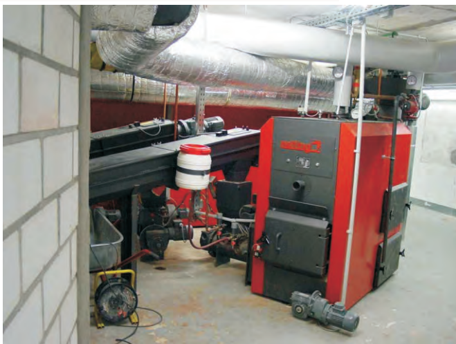
Die beiden Feuerungsanlagen NRF 83 und NRF 722